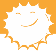
Het afwegingskader in beeld